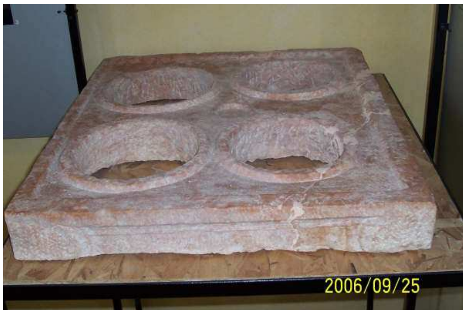
A sinistra: mensa ponderaria